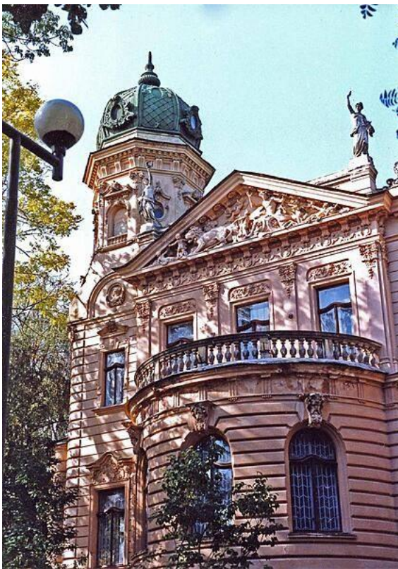
Die neobarocken Dekorationen des Nationalmuseums in Lemberg