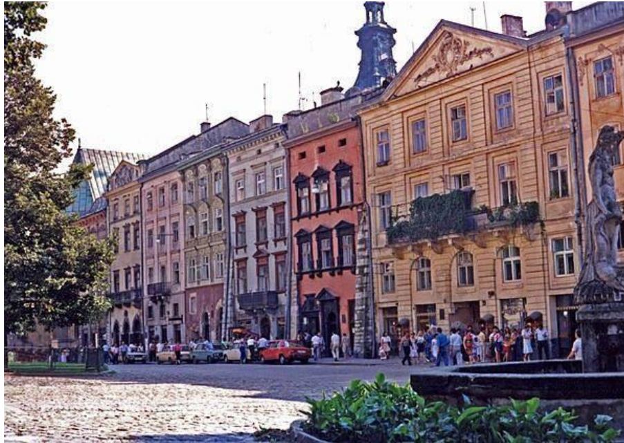
Ein Blick entlang des Rynok-Platzes (Marktplatz) in Lemberg